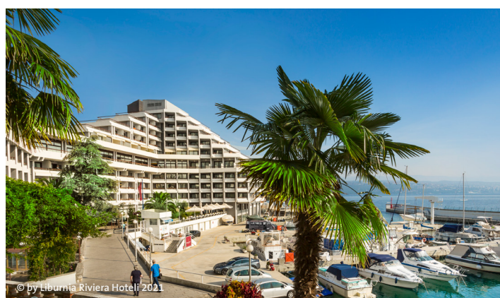
© by Liburnia Riviera Hoteli 2021