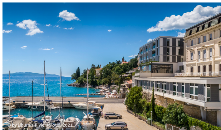
© by Liburnia Riviera Hoteli 2021